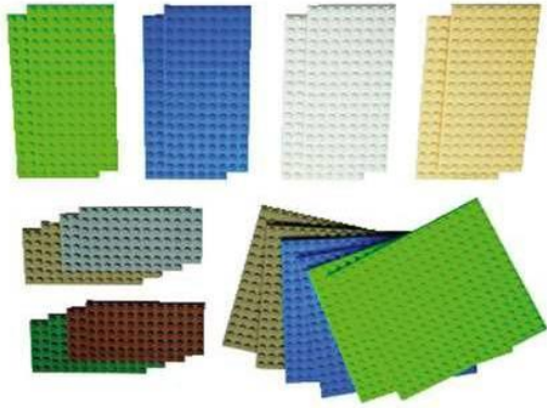
Большие и маленькие пластины, платы