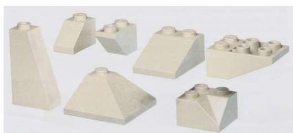
Скошенные кирпичи, клювики